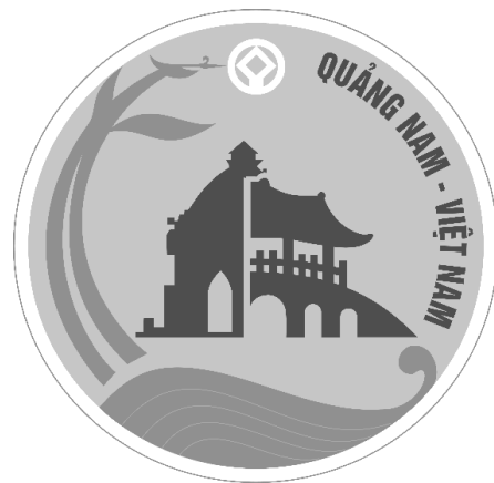
Hình 2. Mẫu in đen trắng