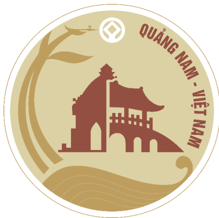
Hình 1. Mẫu in màu

Màu sắc Biểu trưng Quảng Nam được tinh giản và sử dụng màu nâu đậm, vàng đất và vàng nhạt.